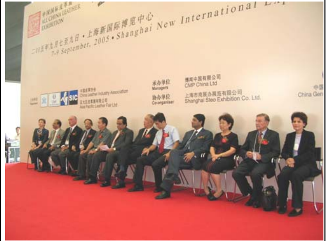
CERIMONIA DI APERTURA - 7 Settembre 2005